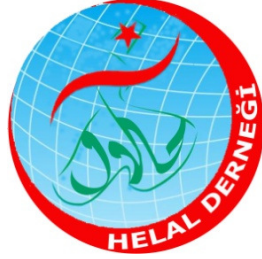
Şekil 1: HelalDer Logosu

HELALDER LOGOSU: HelalDer ismini tanıtmak amacıyla kullanıldığı logodur