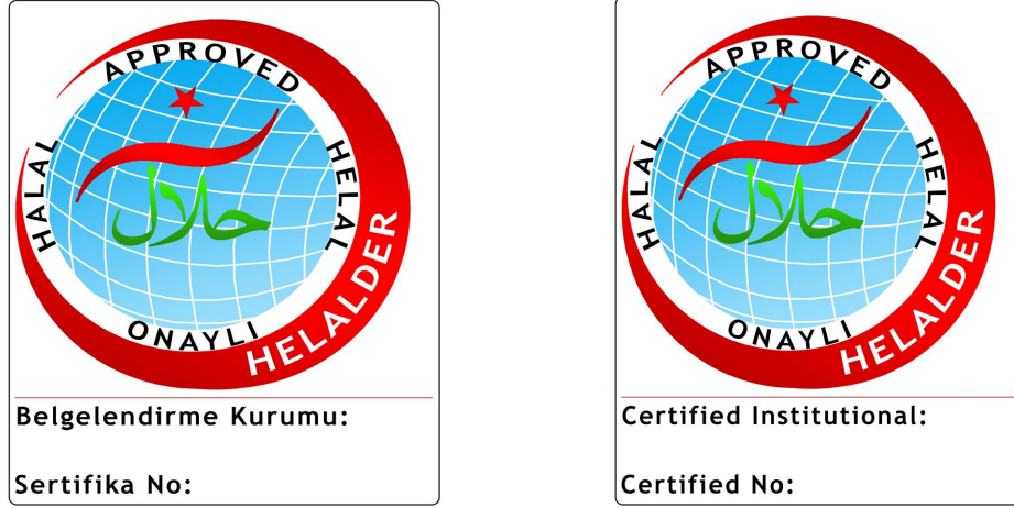
Şekil 4: HelalDer Birincil Ambalaj Logosu

“Bu Ürün Helal Gıda Yönetim Sistemi Helal 22: 2013 standardına uygun olduğu Sağlık, Güvenlik ve Helal Derneği ile ..... tarafından belgelendirilmiş bir tesiste üretilmiştir.” şeklinde olabilir.”